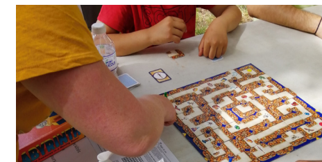
Fête du jeu