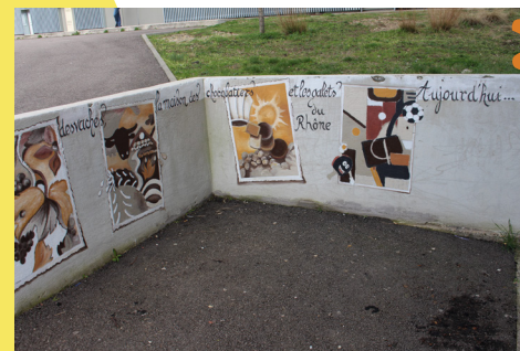
Fresque murale participative au Vallon