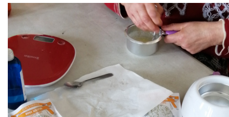
Fabrication de crème naturelle

Toute l'équipe est à l'écoute des habitants (enfants, jeunes, adultes...) pour les accompagner dans la mise en œuvre de projets collectifs .