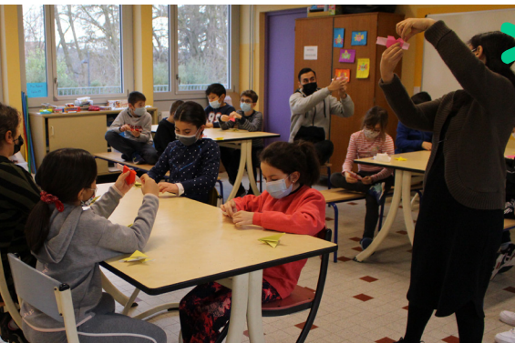
Stage culture du Japon